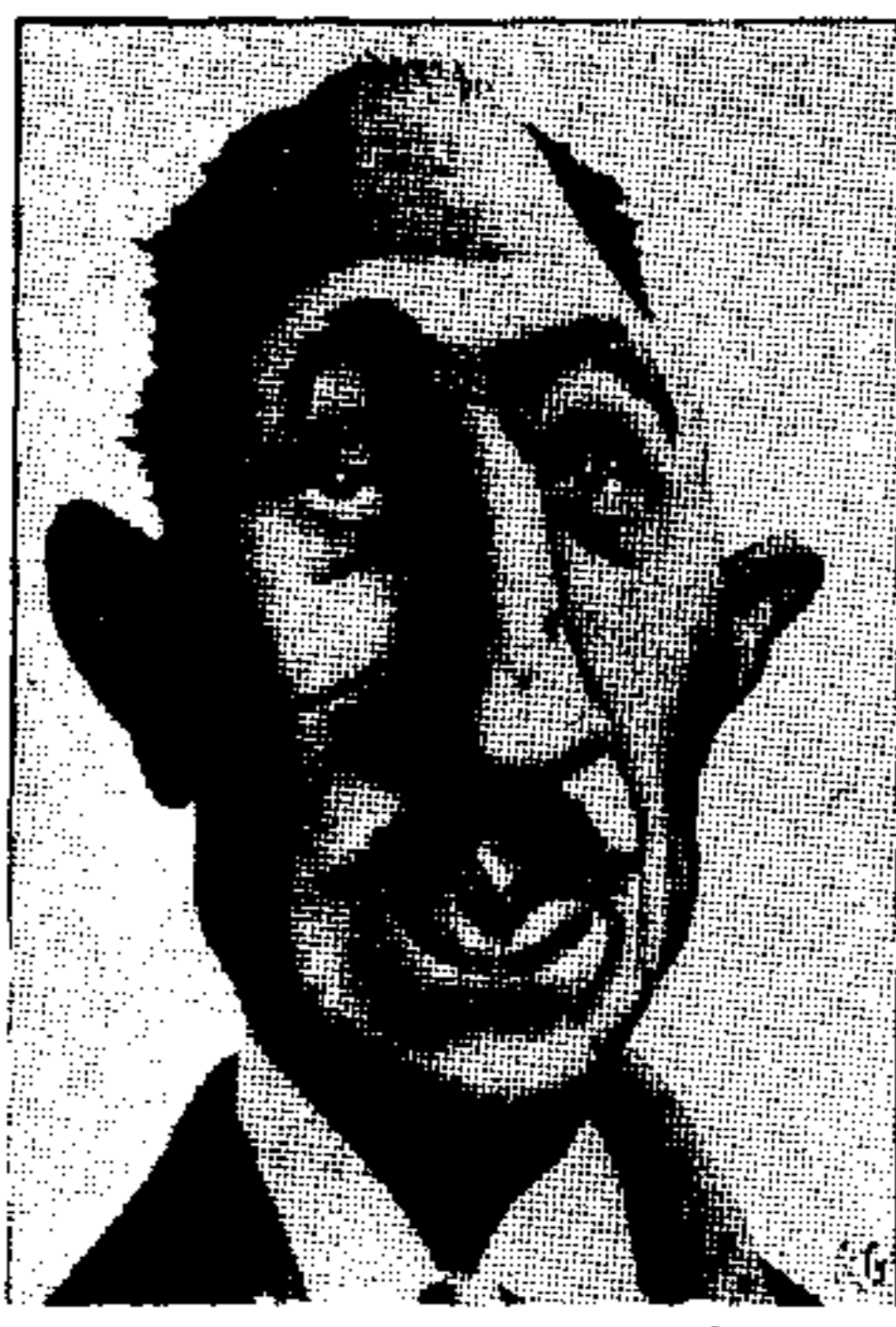
Ο πρόεδρος Σαντάτ